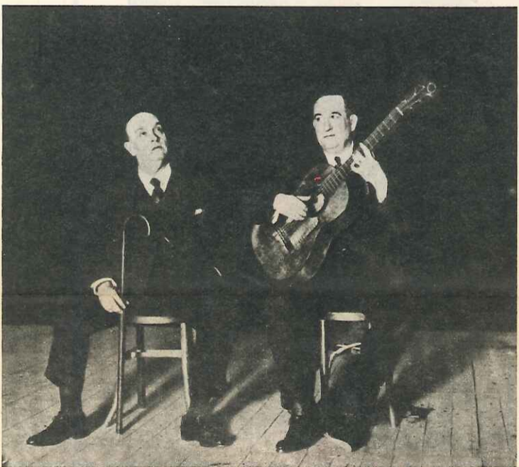
El «cantaor», en una actuación con el guitarrista Montoya.

res» más notables que hasta entonces se habían conocido nunca cobraron más de diez pesetas de jornal...». Y añade, refiriéndose al éxito del joven «cantaor»: «Todos los notabilísimos artistas de la época de Chacón prescindieron de sus derechos de antigüedad y acordaron cantar por delante